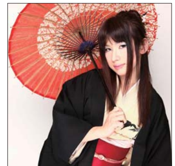
プロデューサー：井上魅夜（♂）

講師を務めるあかねは地声はとても低くてイケメン声なのに、努力を尽くして女声をマスターした人物。いままでになかった、実際にやってみて、声をマスターした人物によるコーチングがウリです。今まで、女性として振る舞いたいと思っていたけれど、声が男性のため、生活の色々なシーンで傷ついて来た方も多かったと思います。そんな方々のため、実践的なコーチングを廉価で提案したい。そんな思いでこのプロジェクトを立ち上げました。